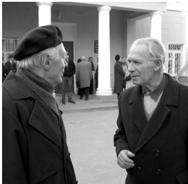
Титаны теоретической мысли

- Честно говоря, не знаю. Думаю, что даже самые авангардные композиторы и то вряд ли могли бы сказать, что то, чем они занимаются – дело будущего.