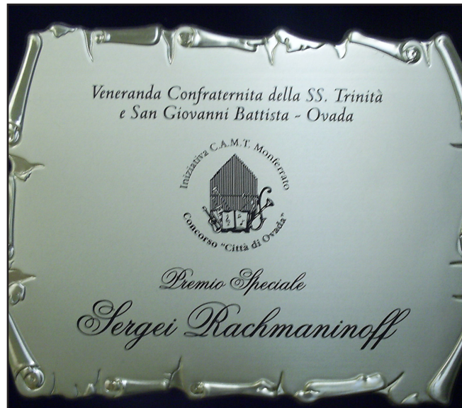
Диплом за лучшее исполнение С. В. Рахманинова