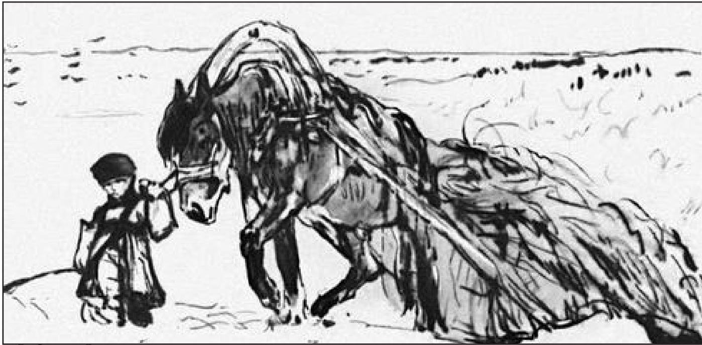
В. Серов. В дороге

Серов – твой любимый художник! Но можно я тоже скажу, какая акварель мне больше всего понравилась?