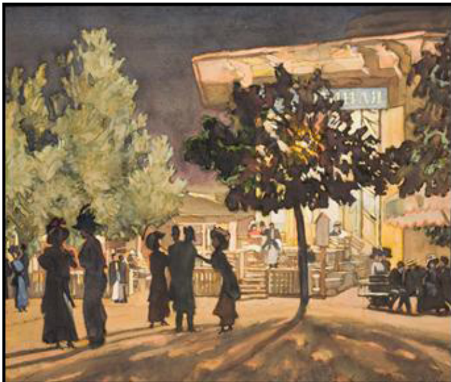
К. Юон. Ночь. Тверской бульвар

– Моей душе больше по вкусу совсем другие темы. Меня привлекают городские пейзажи: тихие скверики, деревянные скамейки, уютные закуские, как на той акварели Константина Юона «Ночь. Тверской бульвар». Я так и вижу нашу дружную воробьиную стаю на этой картине. Мы перелетаем с одного дерева на другое, кружимся под носом официанта, садимся на модные шляпки барышень! Если бы я был художником, я обязательно добавил бы сюда наши изображения.