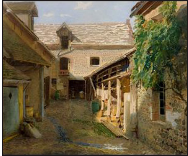
И. Крамской. Деревенский домик во Франции

– Ну да. «Свободное перетекание тонов, мягкость переходов – всё это сообщает акварели ни с чем не сравнимую изысканность художественного языка». Я всё это уже читал в энциклопедии по искусству на прошлой неделе, когда залетал в Российскую библиотеку. Но я же ещё маленький, поэтому ничего не понял! Объясни мне, пожалуйста, нормальным воробьиным языком, что такое «магия акварели»? В чём она заключается?