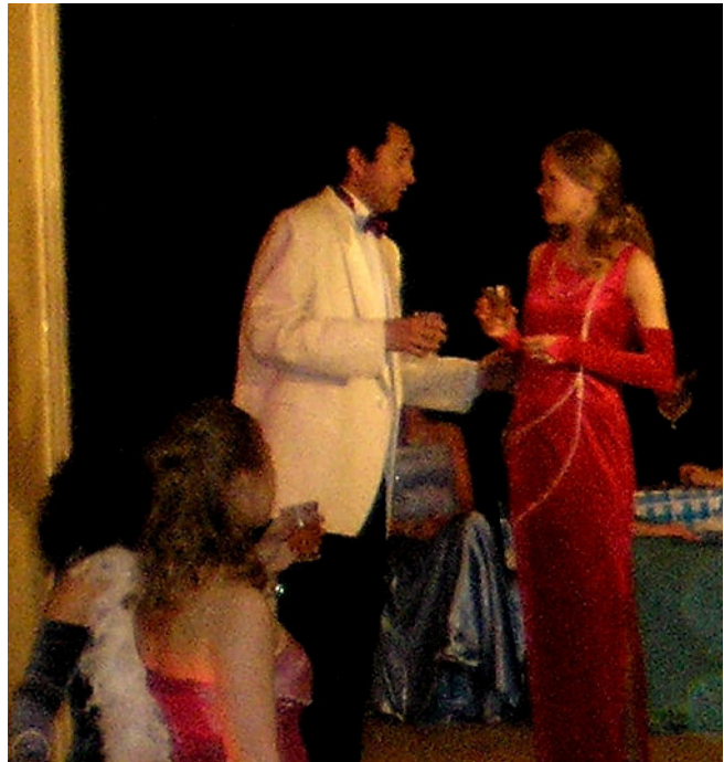
Сцена из оперы «Ласточка» Дж. Пуччини

Первый зритель: Вспомни, как теряет Константин Треплев свою Нину, как устремляется её душа к любви, творчеству и славе, и как обманывается она в своих мечтах. И для Магды поиски счастья заканчиваются трагически.